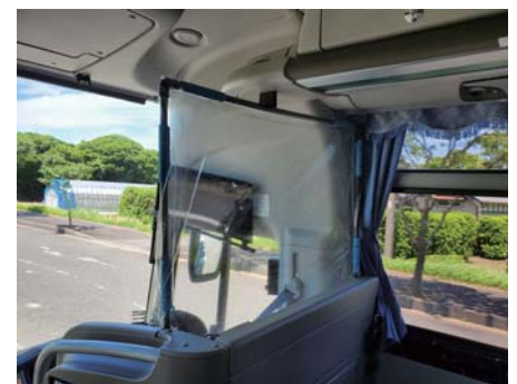
飛沫感染防止スクリーン